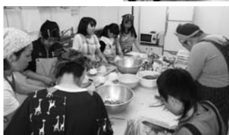
▲餃子の種作りチーム