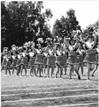
6月11日 新篠津中学校