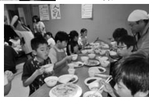
▲みんなで作った餃子は格別♪