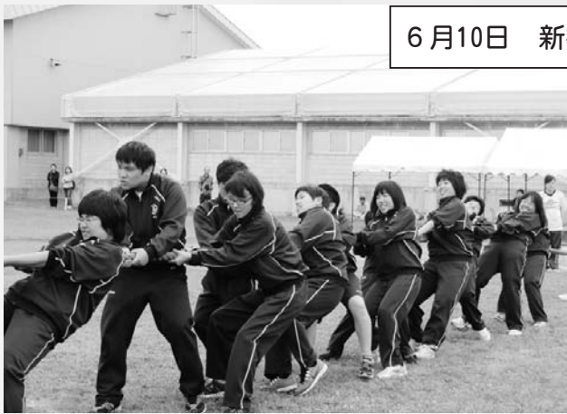
6月10日 新篠津高等養護学校