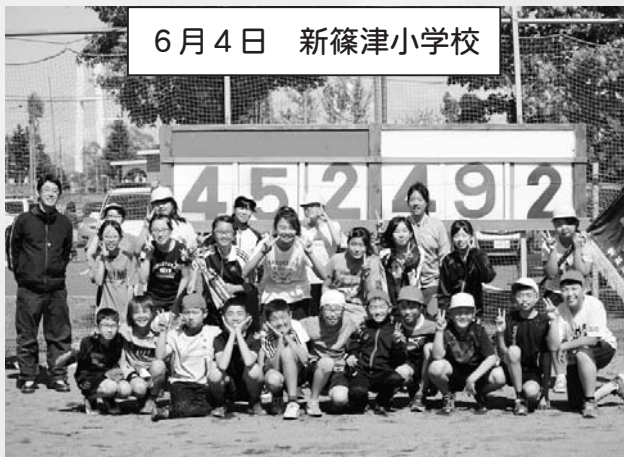
6月4日 新篠津小学校