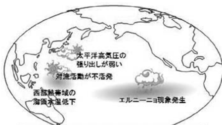
エルニーニョ現象の夏季の天候への影響