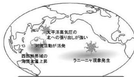
ラニーニャ現象の夏季の天候への影響