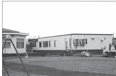
乳児保育所建設工事