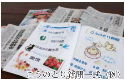
このとり新聞一式 (例)