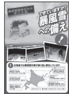
↑リーフレット 「できていますか?暴風雪への備え」

http://www.jma-net.go.jp/sapporo/bousaikyouiku/schoolbousai/boufusetu/boufusetu.html