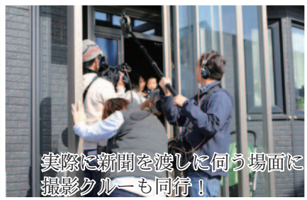
実際に新聞を渡しに向う場面に撮影クルーも同行！

広報のひろば ▽10月26日、新中このとり部が行っているこのとり新聞について、フジテレビ系列「クイズやさいいね」という全国放送されている番組より、取材・収録に訪れた際の様子をご紹介します。 ▽このとり部が取材を受けるに至った経緯は、10月7日の北海道新聞にて、このとり新聞についての紹介記事が、同番組スタッフの目に留まったからだそうです。 ▽放送は、12月下旬以降、フジテレビ系列「優しい人なら解ける クイズやさしいね」の番組内で紹介される予定です。放送日が決まりましたら、防災無線にてご連絡いたします。 ▽最北の地、北海道で、中学生らの手によって心温まる活動が行われていることに、きつと全国の放送を見ている人の心にもやさしい、温かい気持ちが届くことでしょう。 ▽長時間の撮影にも関わらず、終始楽しそうに笑顔が絶えないこのとり部の皆さん、本当にお疲れ様でした！