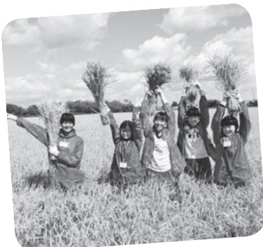
平成27年9月15日～16日 大阪府立豊中高校の生徒さん

初めは当然のごとく、何もかも分からず、都会から来る初対面の生徒をどう受け入れるか…不安はいっぱいだった。『朝、何時に起こしたらいいだろうか』『食事は何時に取らせたらいい