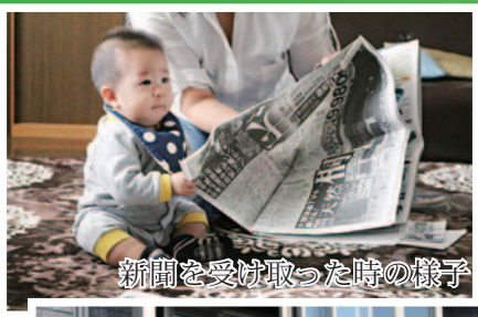
新聞を受け取った時の様子