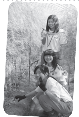
平成27年6月14日～15日大阪府立阿倍野高校の生徒さん