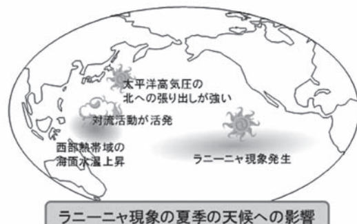
図 エルニーニョ現象、ラニーニャ現象が日本の天候に及ぼす影響