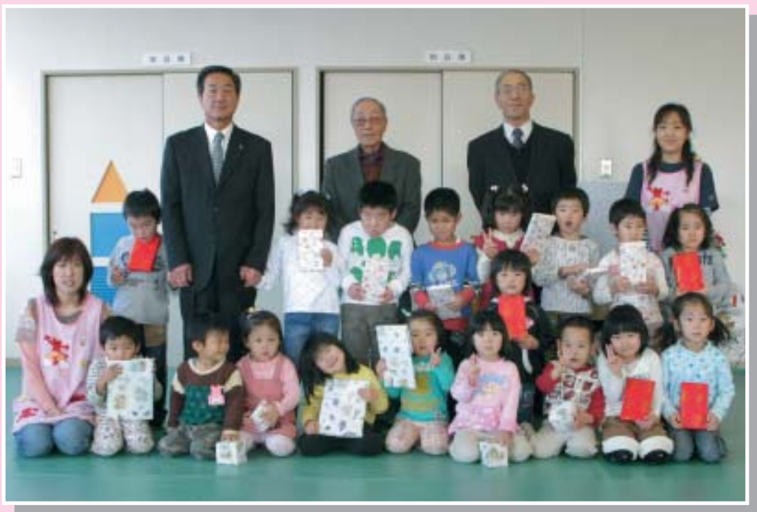
～ たかくら保育所にて～