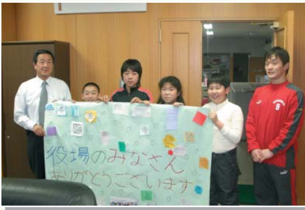
～ お疲れさまでした ～