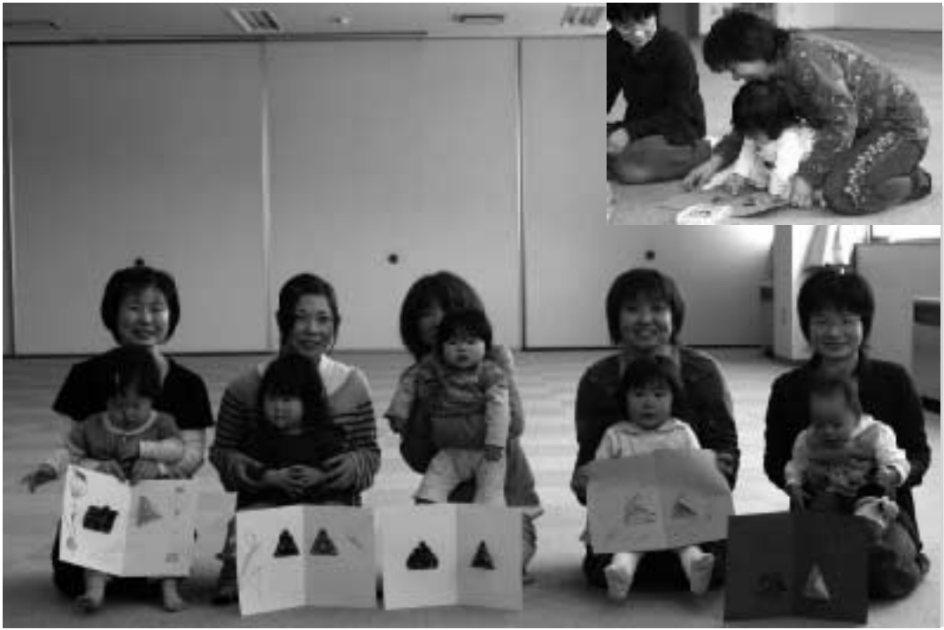
～ 上手にできたよ ～