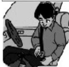
シートベルト着用を

また、夜間におけるウォーキングやジョギングなどの際には黒などの目立たない服装は避け、ドライバーだけでなく歩行者の方なども気配りを忘れず、村民みなで痛ましい事故を防ぎましょう。