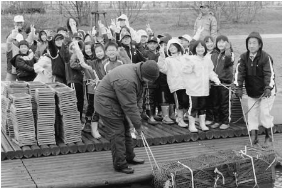
～ 新小4年生 わかさぎふ化盆おろし作業～