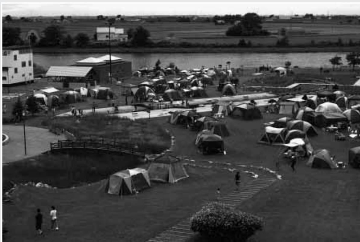
～しんのつ公園キャンプ場 8月13日～