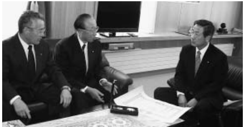
受章の報告に役場に来庁された宮田名誉村民