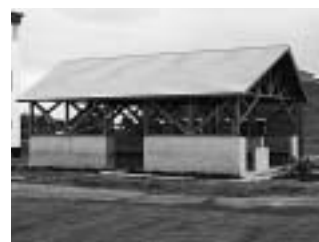
キャンプ場造成工事