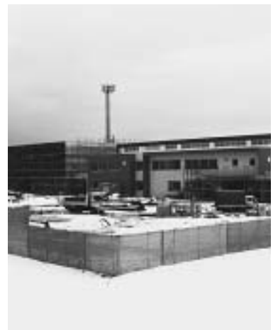
中学校改築工事11 / 19現在