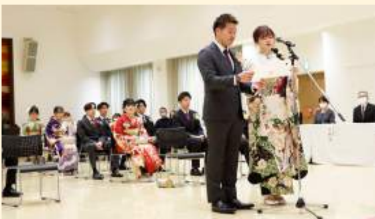
式典にて「誓いのことば」を一人で読み上げる様子