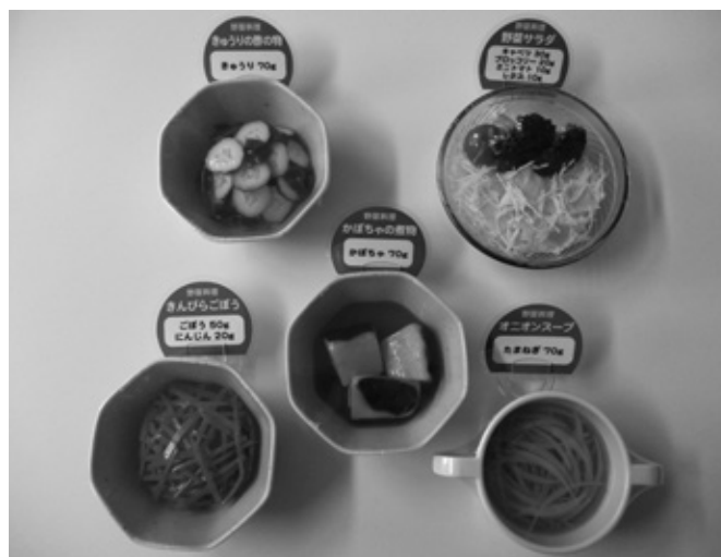
5皿分の料理の目安