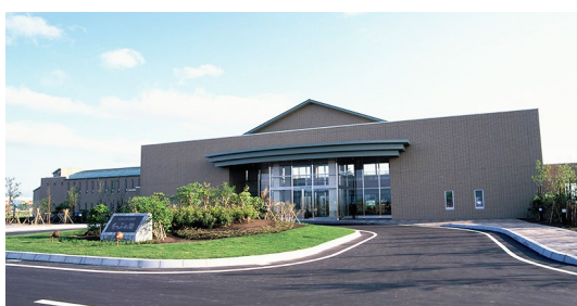
大規模改修が予定されている「しんのつ温泉 たつぷの湯」

温泉施設で働く従業員などは改修による休業期間中、それらの管理施設での業務を検討していただき、たつぷの湯がリニューアルし、営業を再開した後の運営がスムーズに行われるよう雇用要件について指定管理者からの考えを聞き、村ができることを検討したい。