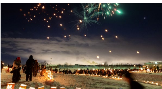
4,000人の来場者を集めた第5回天灯(ランタン)祭り