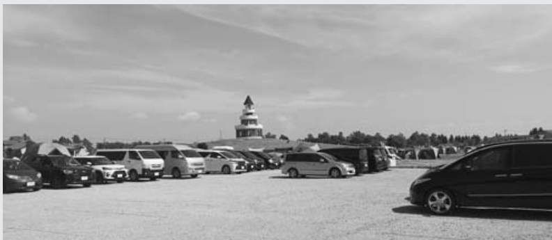
便利になったとキャンプ場利用者の評判も上々の増設部分