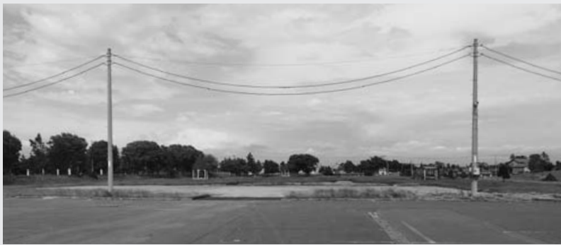
旧パークゴルフ場の一部が造成され、完成した駐車スペース