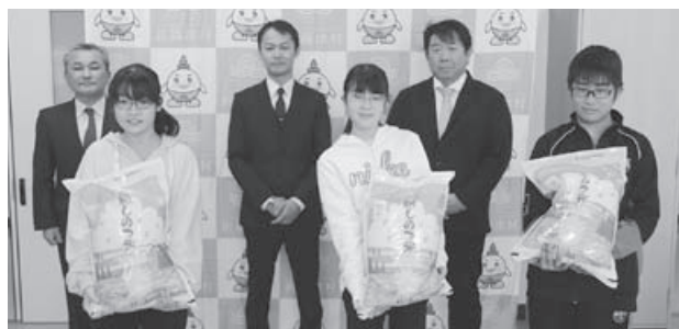
毎年イエスクリーン米を子どもたちに届ける生産者

今後も「地産地消」の考えに沿った給食を提供し、生産者の努力が子どもたちに伝わる給食メニューの献