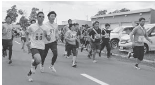
感染リスクを抑え開催されることが望まれる駅伝大会（写真は2018年）

教育委員会としては、駅伝大会の後援者として、相談があれば協議の輪に加わり出来る限りの支援・協力を惜しまない考えている。