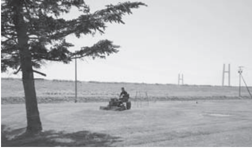
芝張りを終えたふれあい公園パークゴルフ場