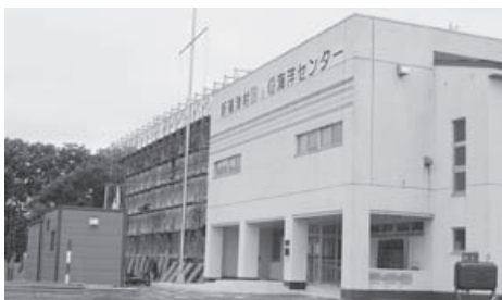
改修工事が行われている B & G海洋センター体育館

屋根・外壁塗装一式 アリーナ改修及び照明器具取替、トイレ改修及び多目的トイレ新設、トレーニングルーム新設 契約金額 9579万6000円