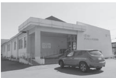
村内唯一の診療所「すこやかクリニック」

本村としては、医療体制の維持のため、「医療法人すこやか」ときめ細かな協議を重ね、支援を継続すると共に、建て替えか、大規模改修かについては、建物の老朽化等の調査を実施し、施設の状況を把握した上で中長期的に施設整備を検討したい。