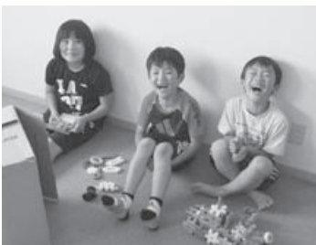
社会福祉協議会が運営している学童保育の一環「託児事業」

※放課後子供教室Ⅱ放課後や週末に子供たちの居場所をつくるため、校庭や教室を開放し、地域住民の協力によってスポーツや文化活動ができるようにする取組。