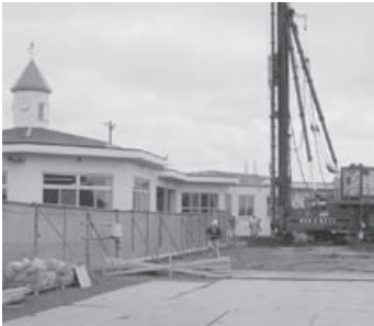
着手された乳児保育所建設工事

工事概要 木造平屋建228・13㎡ 保育室3室、厨房設備一式 契約金額 1億3770万円