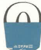
調査員が持ち歩く 手さげ袋（見本）

※一部の地域では、調査員業務を「建物を管理する事業者等」に委託しており、『国勢調査業務委託証明書』を携帯しています。