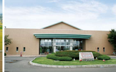
しんのつ温泉たっぷの湯