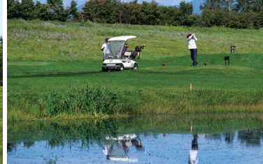
ニューしのつゴルフ場