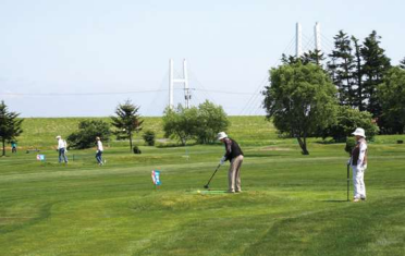
ふれあい公園パークゴルフ場