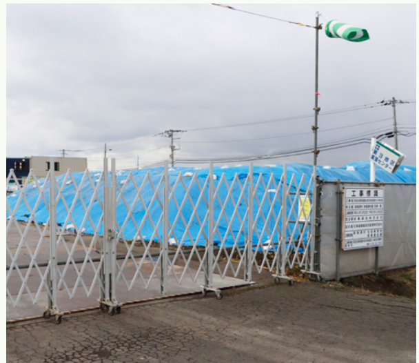
第3地区会館建設工事

村の予算執行状況は、9月末現在一般会計 17億1,233万円 の支出です。 一般会計の予算計上額は、当初予算と9月 までの補正額です。